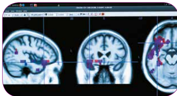
Analyse d'images d'IRM encéphaliques. Plateforme d'imagerie et de neuroinformatique "Neurinfo", service radiologie IRM du CHU Pontchaillou, Rennes. Unité mixte de recherche : Inserm, Université Rennes 1, INRIA, CNRS, IRISA.